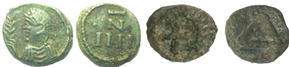
Figura 4. Moneda vándala de 4 nummi (izda.) 7 . Moneda de Cartago Spartaria de 4 nummi (dcha.) (col. priv.)

El valor de 4 nummi es poco frecuente en el mundo bizantino. Se conocen los acuñados en Tesalónica a nombre de Justiniano I, del tipo busto/delta. Por el contrario la amonedación en el reino vándalo si incluyó profusamente las piezas de 4 (fig. 4) y 12 nummi como valores comunes. Su sistema monetario era en realidad trimetalico; la unidad era el sólido de oro, dividido en 24 silicuas (peso de una semilla de algarrobo, unos 0,19 gramos) y con equivalencia teórica de 12000 nummi de bronce.