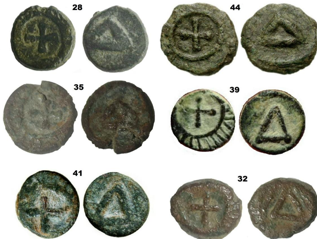
Figura 3. Diferentes cuños de 4 nummi (no a escala).

Las monedas presentan una tipología de diseño variado, especialmente en la cruz de los anversos, un estudio directo y completo de las piezas podría llegar a distinguir los diferentes cuños. El más representativo (fig. 3) es el que muestra una cruz griega patada (n° 28 de Tabla); hay otros menos frecuentes con cruz griega pometeada (n° 44), cruz griega trebolada (n° 35), cruz latina pometeada (n° 39), cruz latina lineal (n° 41), cruz asimétrica lineal (n° 32).