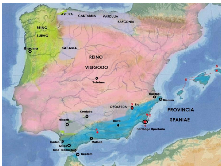
Figura 1. Hispania sobre el año 560 d.C. (del autor).

A mediados del siglo VI, Hispania 2 estaba fragmentada; los visigodos, establecidos, mayoritariamente en el valle del Duero, controlaban una amplia franja ( Lusitania , Tarraconensis y el norte de la Carthaginiensis , donde establecieron su capital, Toletum ). En el noroeste ocupando Gallaecia (actual Galicia, Norte de Portugal y oeste de Asturias y León) reinaban los suevos. Otras zonas poco romanizadas estaban bajo control de la aristocracia o jefes locales: toda la cornisa cantábrica y los pirineos occidentales (Asturias, Cantabria, Vardulia y Basconia ), también Sabaria (zona colchón entre el reino suevo y el visigodo, situada en un territorio indeterminado entre el norte de Salamanca y Benavente). La Bética estaba nominalmente bajo control del rey visigodo, pero zonas como la Orospeña (en parte de la Carthaginiensis ) y ciudades como Corduba o Hispalis , que estaban dominadas por las élites económicas, hispanorromanas o godas, gozaban de amplia autonomía, cuando no de una independencia de hecho (fig. 1).